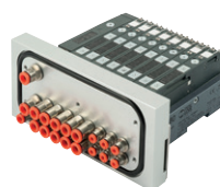
Ventilinsel für den Spritzbereich in der Lebensmittelindustrie, Reihe HDM, EB 80, von 4 bis 16 Ansteuerungen

Round stainless steel cylinders, diameters from 32 to 63 mm